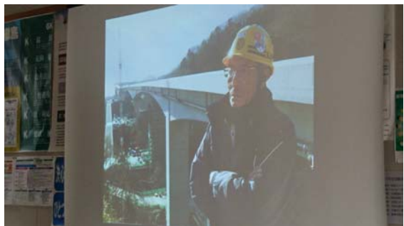
優秀賞（タイトル：この道 50 年、25 番 目の橋がまもなく完成する）