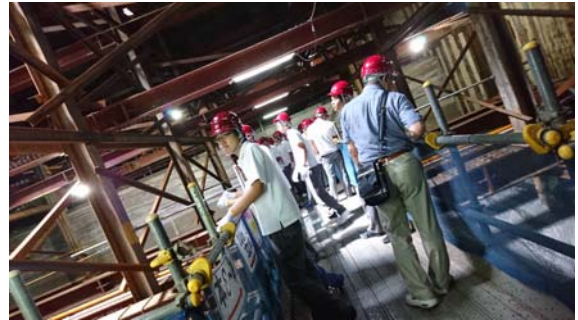
土留, 切梁, 中間杭等の説明