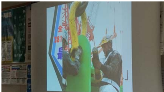
最優秀賞（タイトル：巨大ピンを挿入）