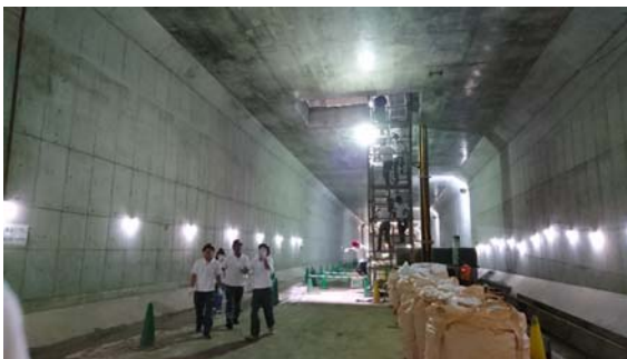
階段で地下空間へ