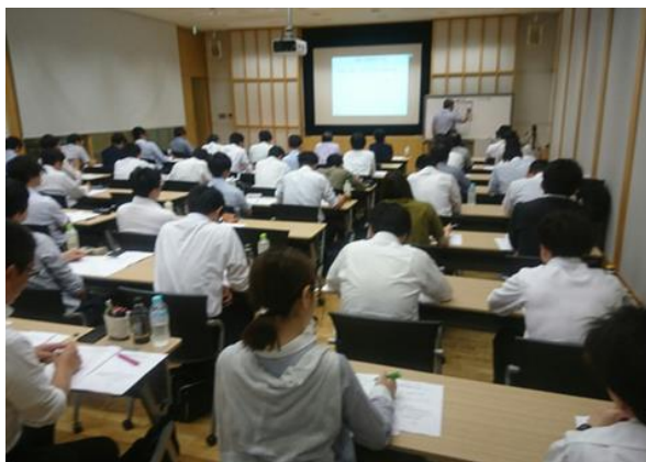
写真-1 本部地下1階の講習会