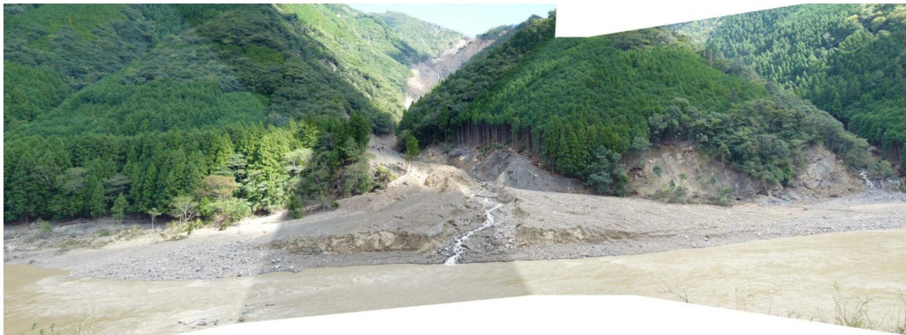
対岸国道168より 崩壊全景