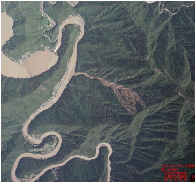
崩壊後 2011年9月7日撮影