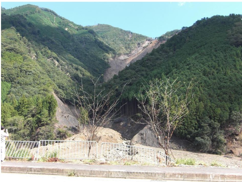
対岸国道168より 歩道柵が変形している(越波の影響(?))