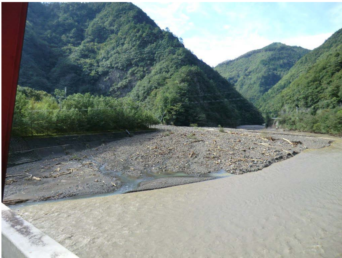
川原樋川合流部まで流出した土石