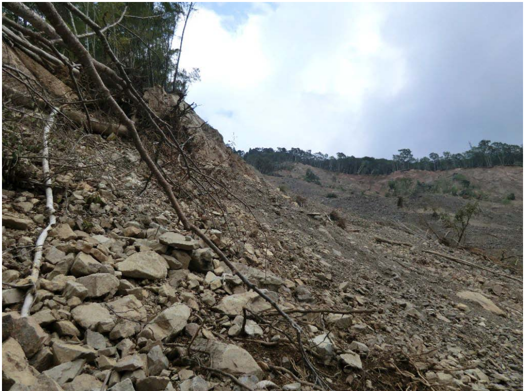
下流側標高800m付近の側壁. 旧崩積土が堆積