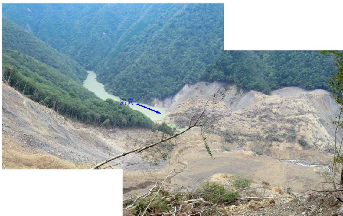
河道を埋積した崩積土と堰止め湖