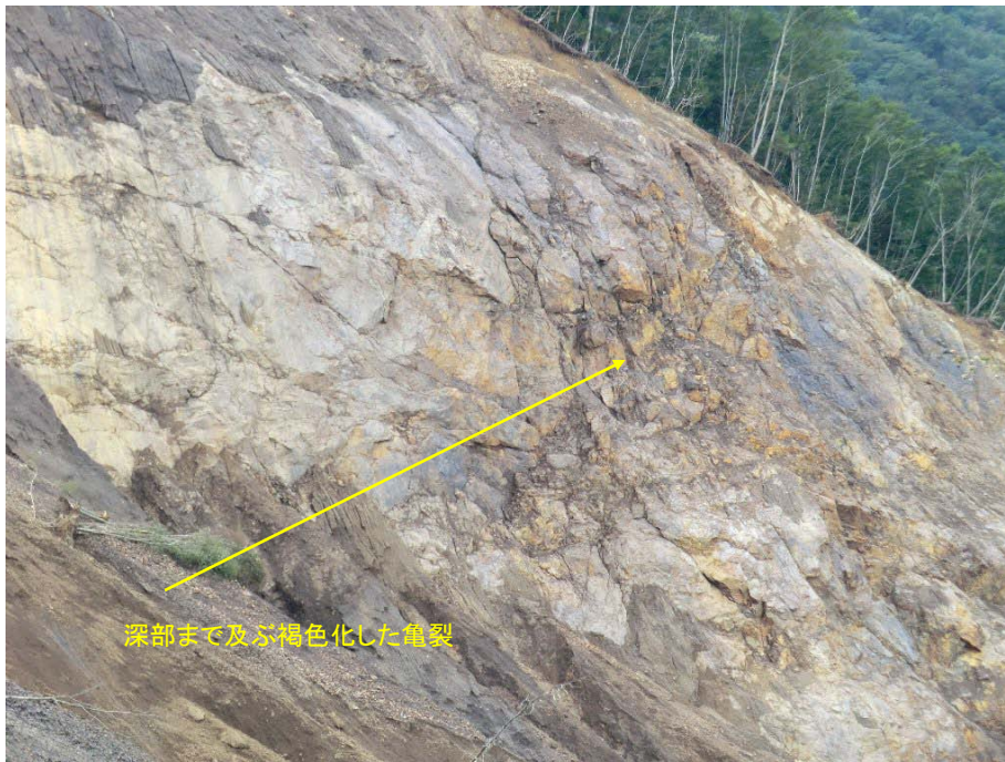
滑落崖を形成する分離面と深部まで及ぶ褐色亀裂