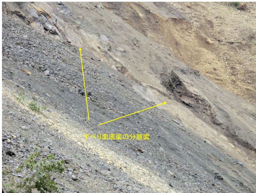
すべり面底面の分離面 北東-南西走向, 35° 北西傾斜