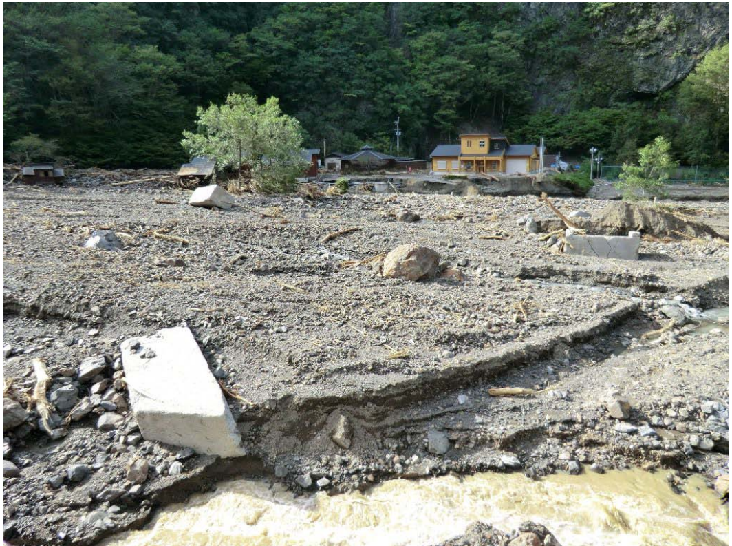
赤谷川河道に堆積した土石