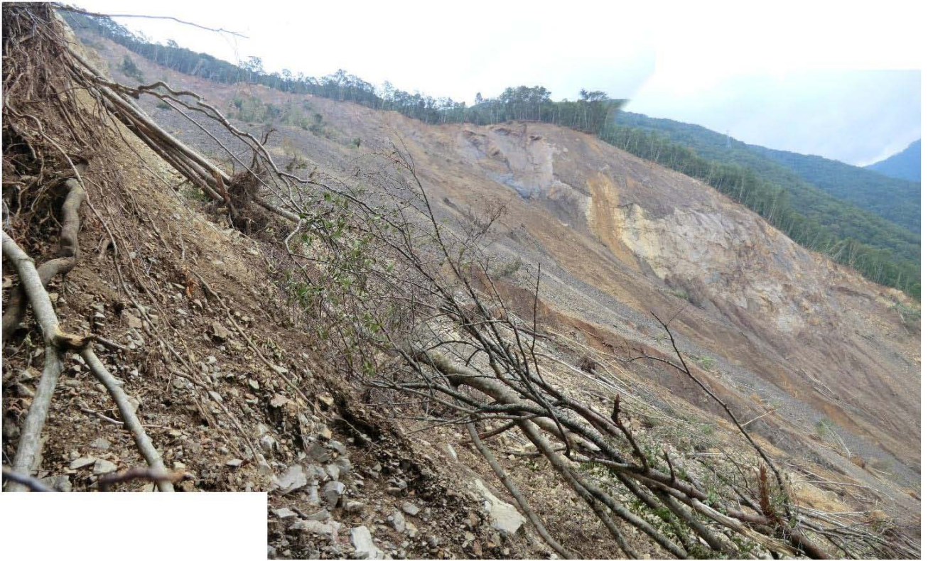
崩壊地頭部から上流側高所の滑落崖