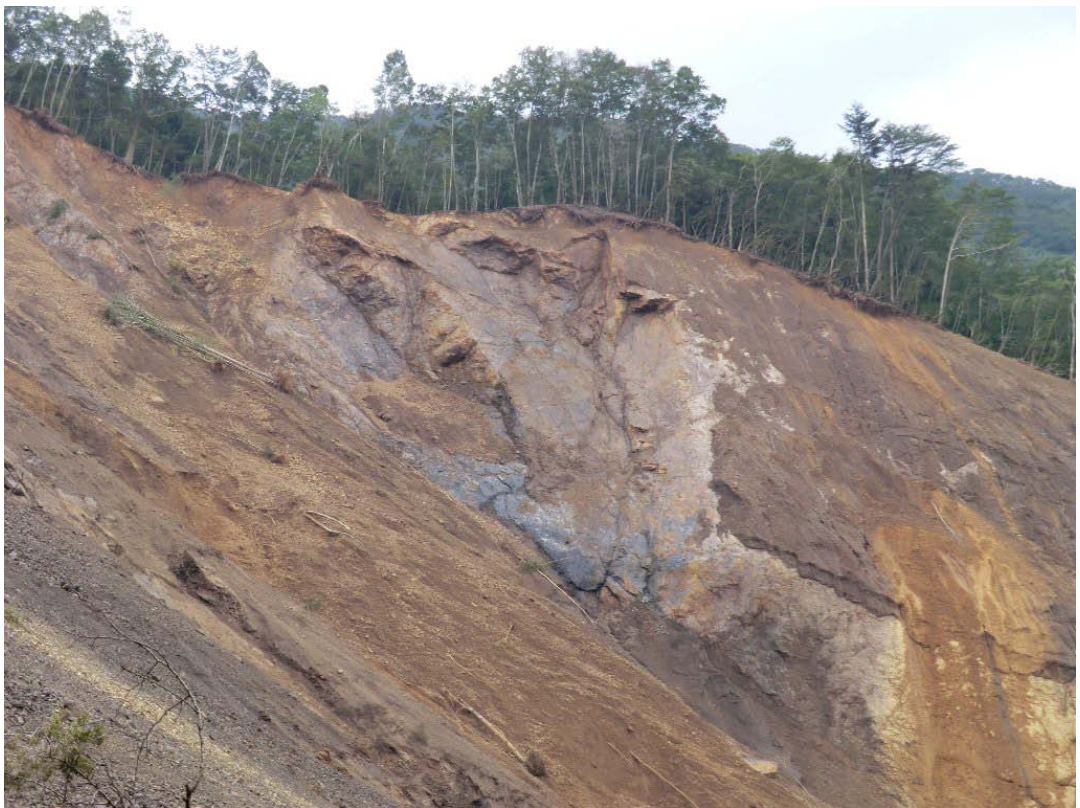
上流側側方の滑落崖を形成する分離面 東西走向, 北40~50° 傾斜 亀裂面の褐色化が著しい