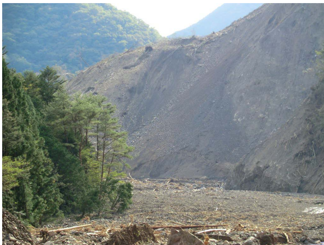
下流から見た土砂ダム