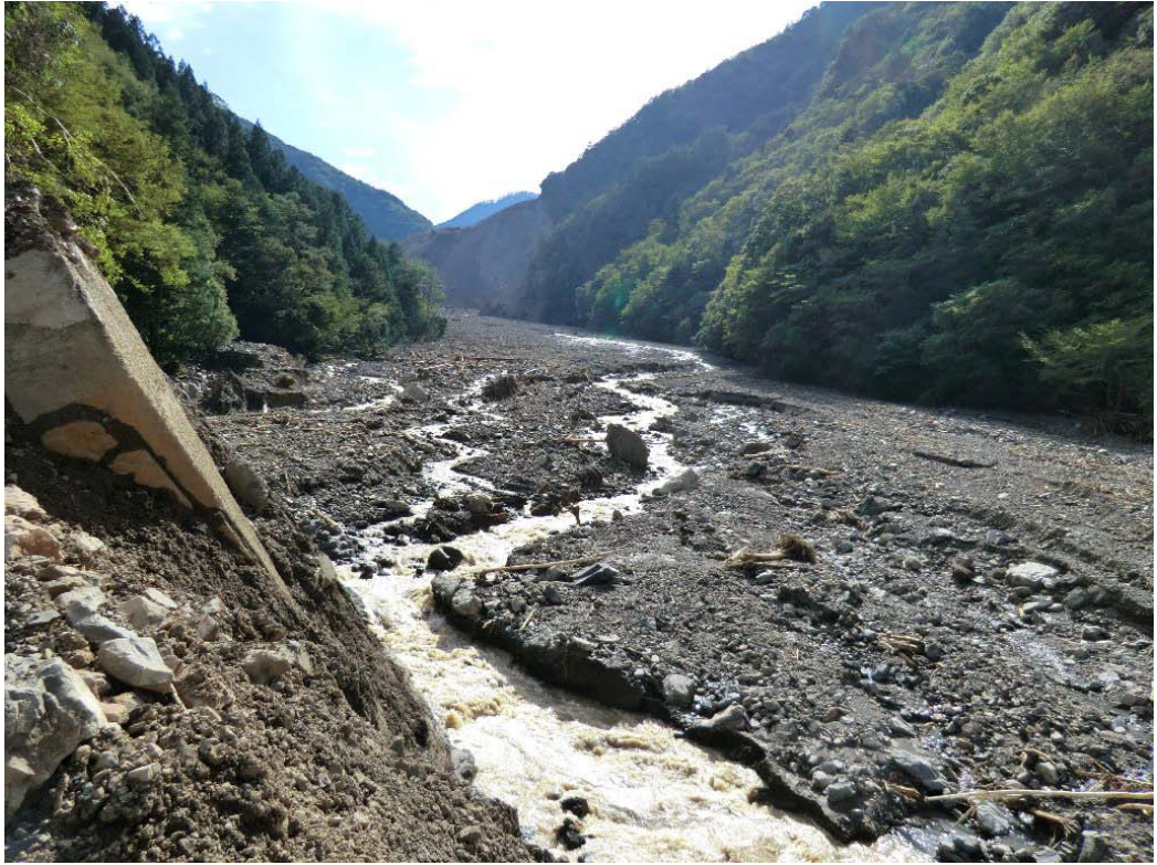
赤谷川河道に堆積した土石