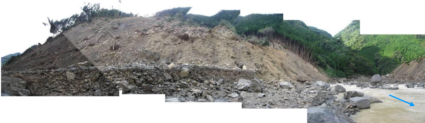
写真-2.8 河川によって浸食された崩積土(清水地区)