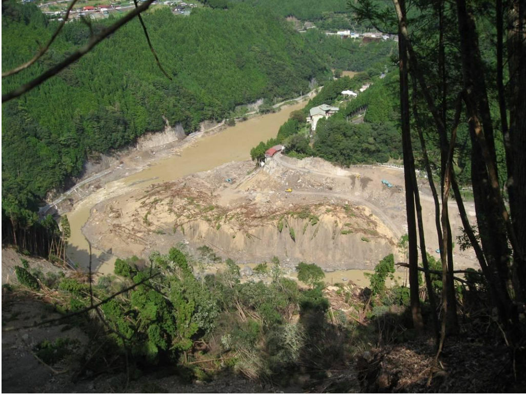
写真-2.7 対岸の宇井地区に乗り上げた崩積土