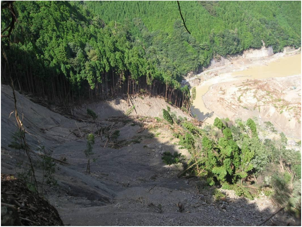
写真-2.5 斜面下方に残存する崩積土