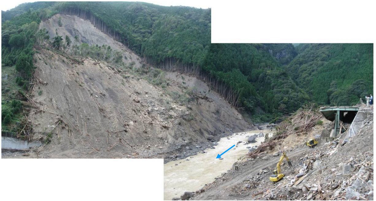
写真-2.1 清水地区崩壊地全景(対岸より)