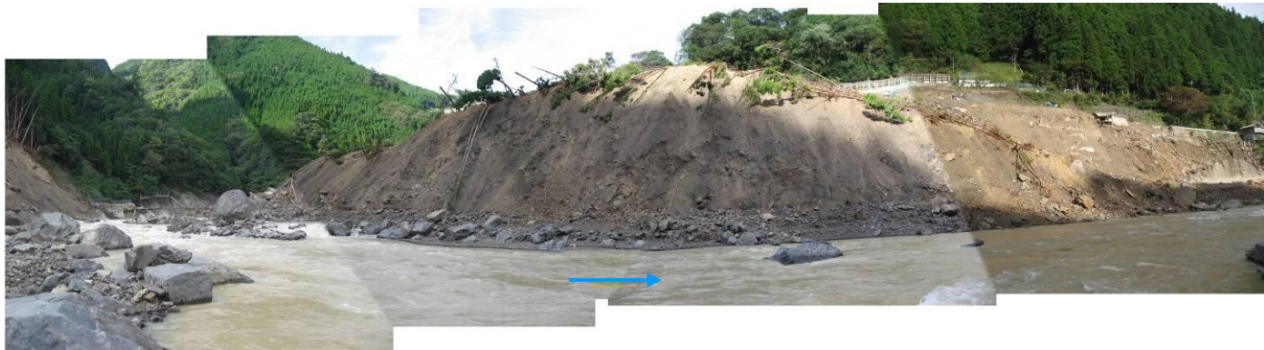
写真-2.9 河川によって浸食された対岸から乗り上げた崩積土(宇井地区)