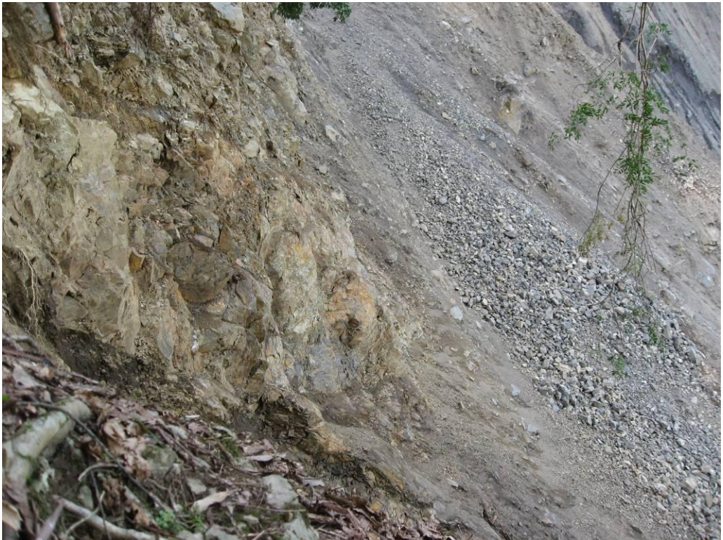
写真-2.6 崩壊地右岸側の露頭