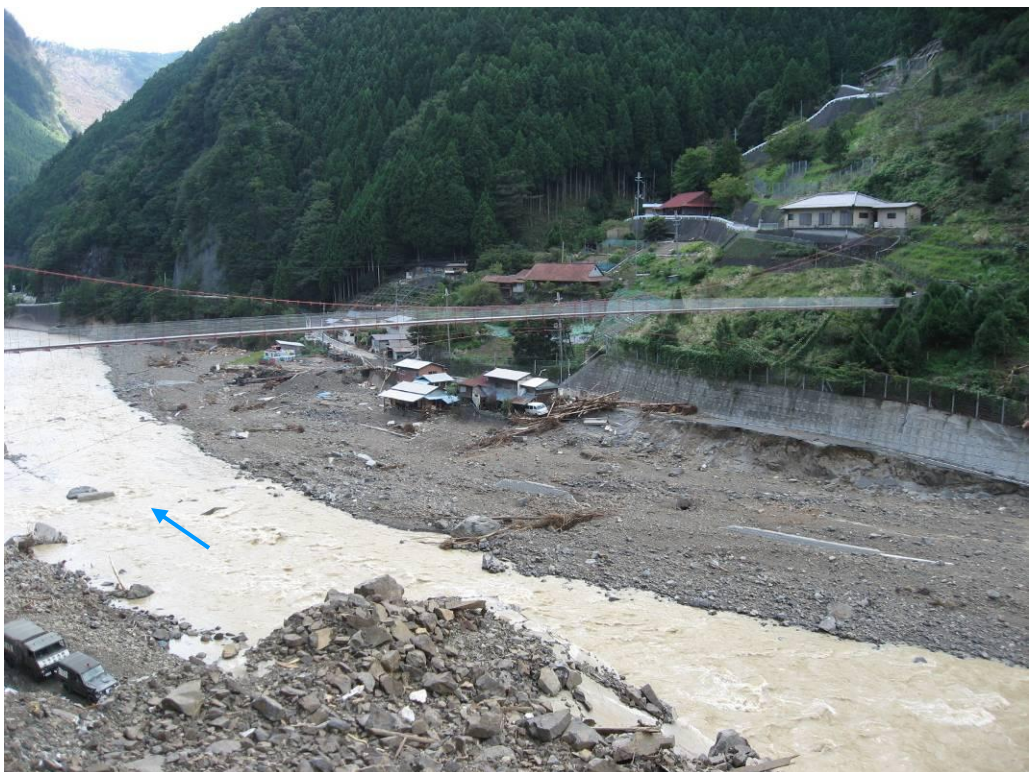
写真-2.2 清水地区崩壊地下流側の河川状況と集落