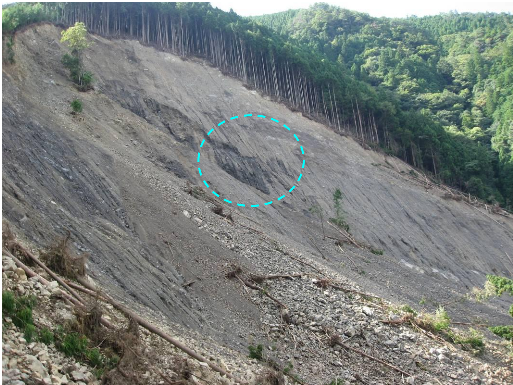
写真-2.4 崩壊地頭部の湧水跡