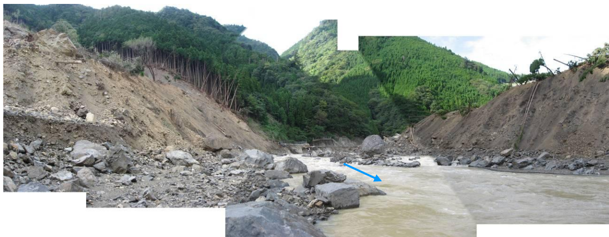
写真-2.10 崩積土が浸食された後の河川状況(左岸側清水地区と右岸側宇井地区)