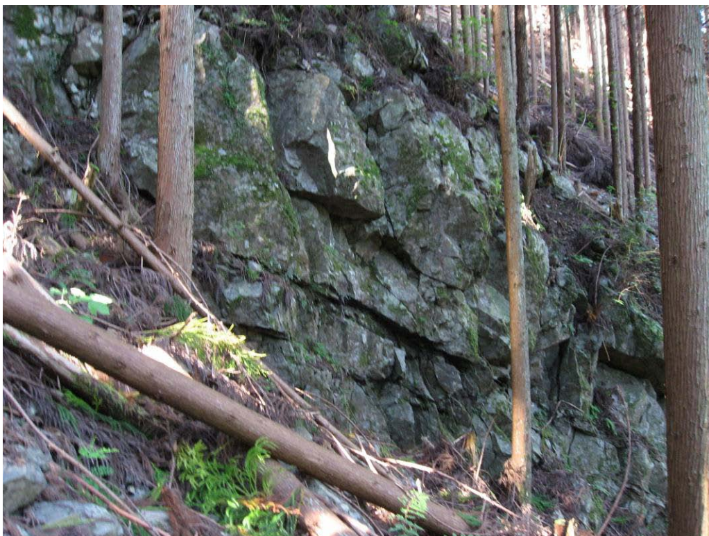
写真-1.6 崩壊地左岸側の露頭(鍛冶屋谷)