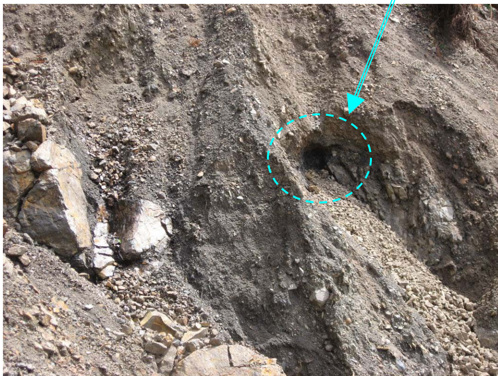
写真-1.14 崩壊地中腹の左岸側に見られる水みち跡