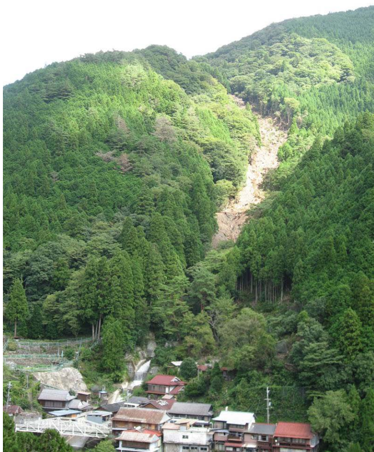
写真-1.7 柳谷崩壊地全景(対岸より)