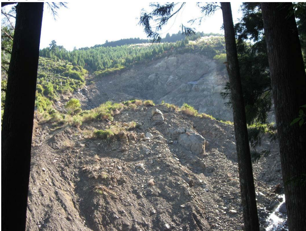
写真-1.5 頭部に残存する不安定土塊(鍛冶屋谷)