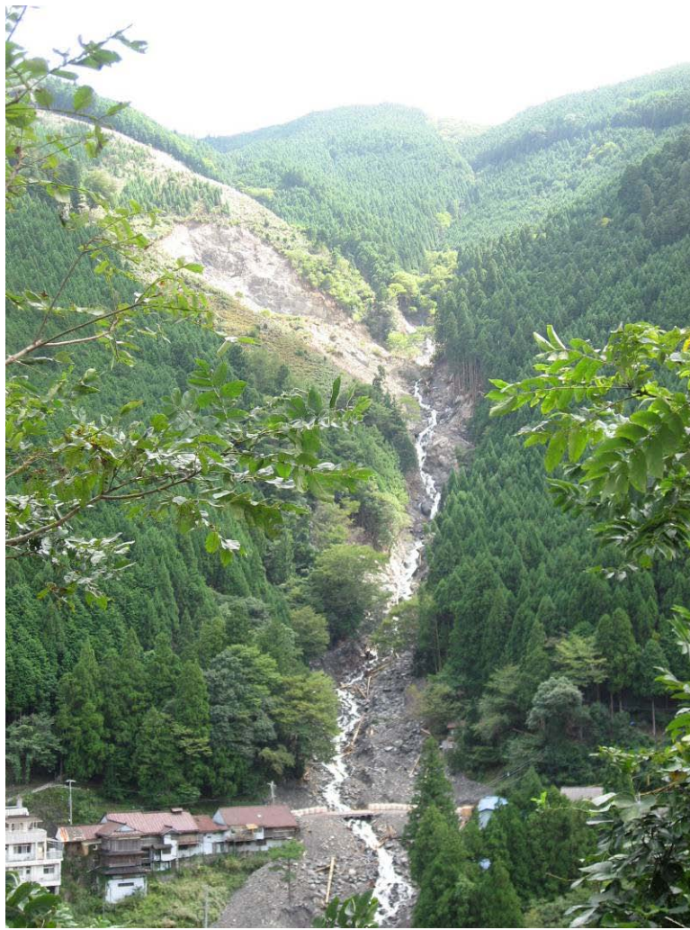
写真-1.1 鍛冶屋谷崩壊地全景(対岸より)