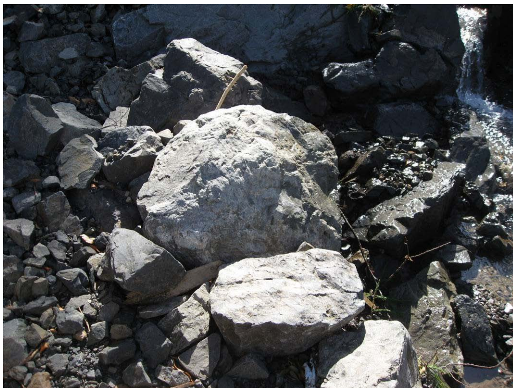
写真-1.4 土石流によって運ばれてきたφ1m程度の巨石(県道付近)