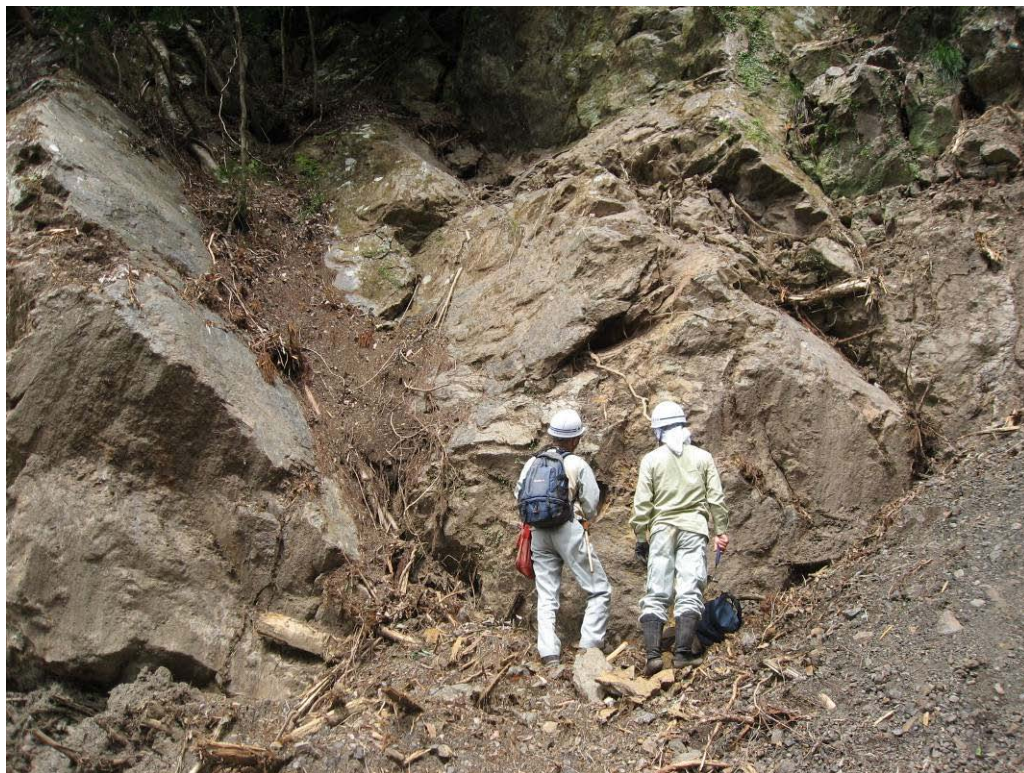
写真-1.12 崩壊斜面右岸側の露頭(柳谷)