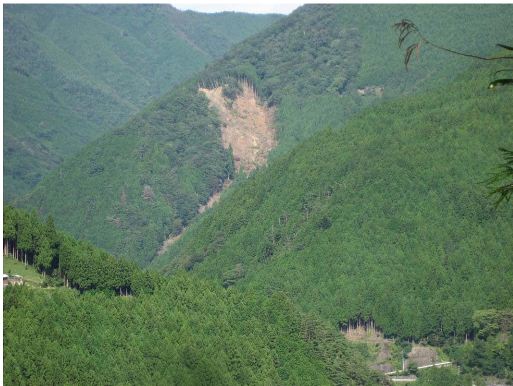
写真-1.8 柳谷崩壊地頭部(対岸より)