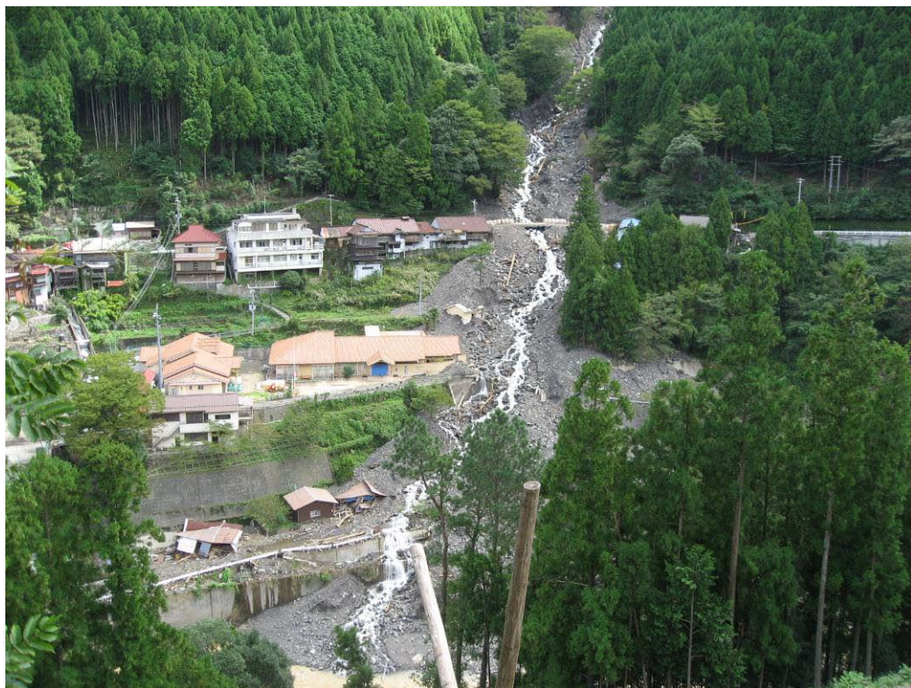
写真-1.3 県道付近における崩積土(鍛冶屋谷)