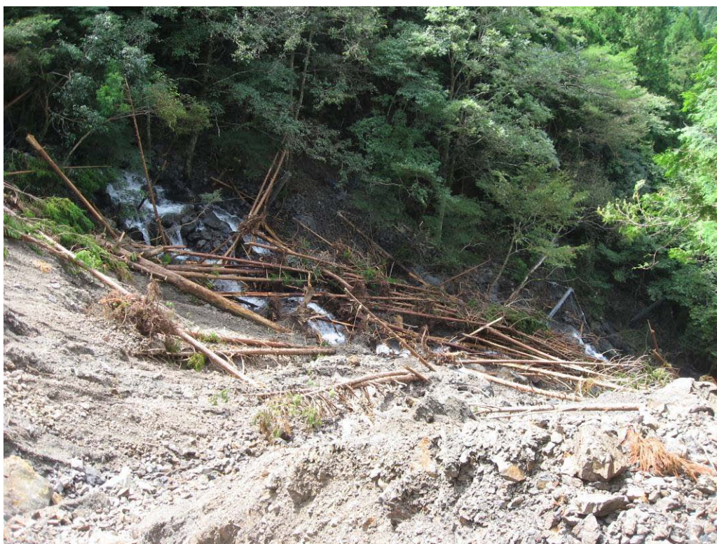
写真-1.10 リングネットで捕捉された土砂・流木(柳谷)