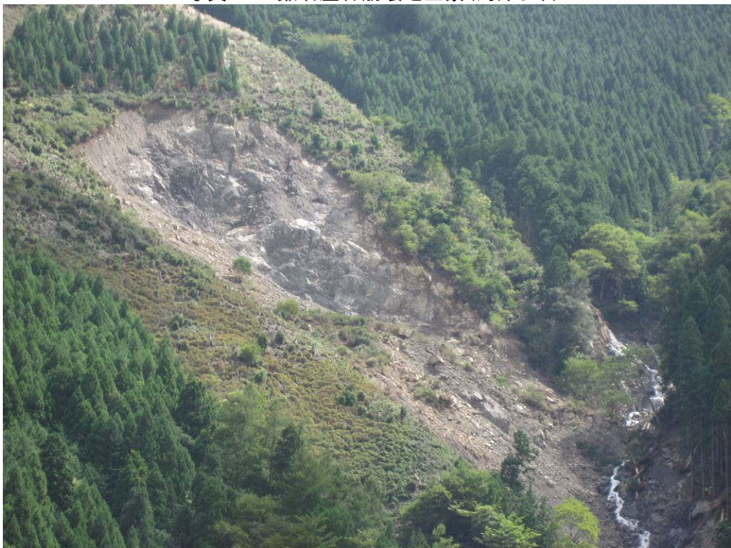
写真-1.2 鍛冶屋谷崩壊地頭部(対岸より)