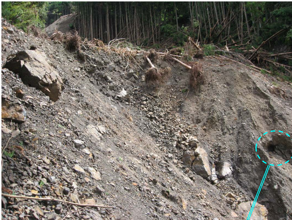
写真-1.13 崩壊地中腹の側方崖(左岸側)