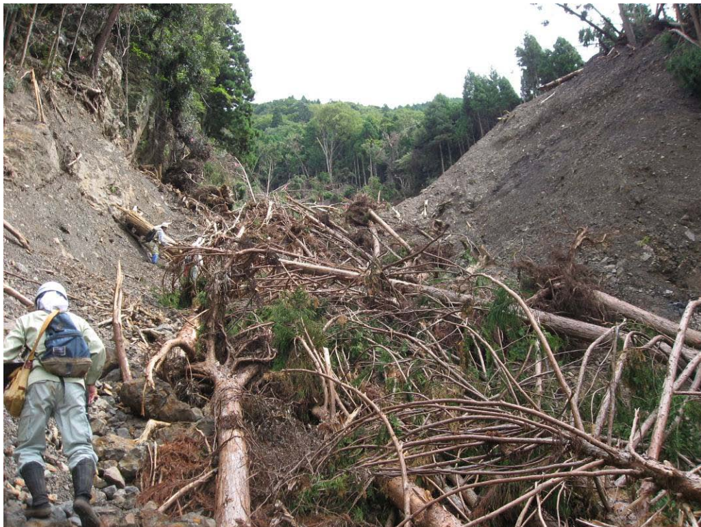
写真-1.11 左岸側旧崩積土が削られた跡(崩壊斜面中腹)